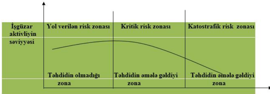
Şəkil 1. Biznes subyektlərində böhran hallarının yaranmasının risk və təhdid zonaları

Risk iqtisadi təhlil obyektini hesab edildiyindən təhdidlərə də məhz risk müstəvisindən yanaşma tələb olunur. Çünki təsərrüfat praktikasının ən çox öyrənilən elementi hesab edilən risk təhdidlərin yaranma mənbəyidir və iqtisadi təhlükəsizliyə təhdid yaradan amillərin tədqiqi risklərin təhlili ilə paralel şəkildə aparılmalıdır. Deməli, belə qənaətə gələ bilərik ki, təhdid riskin inkişaf variantı və ya mərhələsidir ( şəkil 1 ).