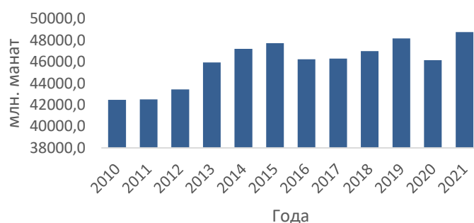
Рис. 1. Динамика уровня ВВП Азербайджана в 2010-2021 гг

Одним из основных показателей экономического роста в мировой экономической литературе является долговременный рост валового внутреннего продукта как в абсолютном, так и в относительном выражении. Поэтому начать анализ целесообразно с оценки динамики ВВП Азербайджана за период 2010-2021 гг. Для того чтобы вовремя анализа динамики исключить влияние уровня инфляции, для расчетов будем использовать ВВП в сопоставимых ценах базисного периода.