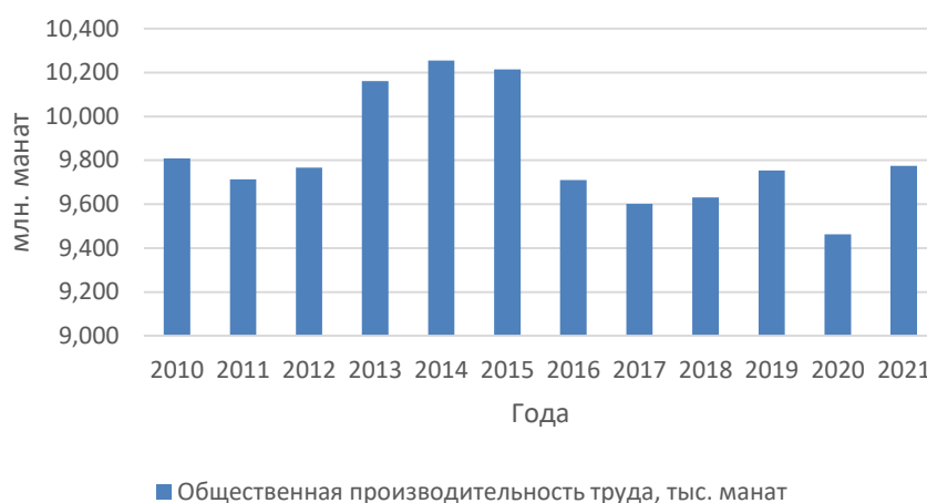
Рис. 2. Динамика уровня производительности труда Азербайджана в 2010-2021 гг

Источник: построено автором по данным [7; 8]