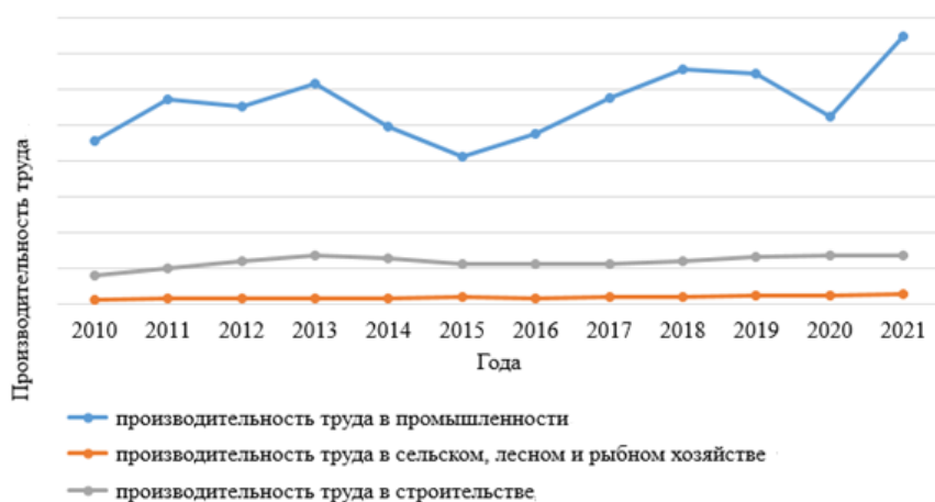
Рис. 3. Динамика уровня производительности труда в промышленности, сельском, лесном и рыбном хозяйстве, а также строительстве в 2010-2021 гг. (млн. манат)

Источник: построено автором по данным [7; 8]